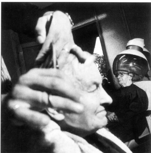
Maison de retraite série en couleur