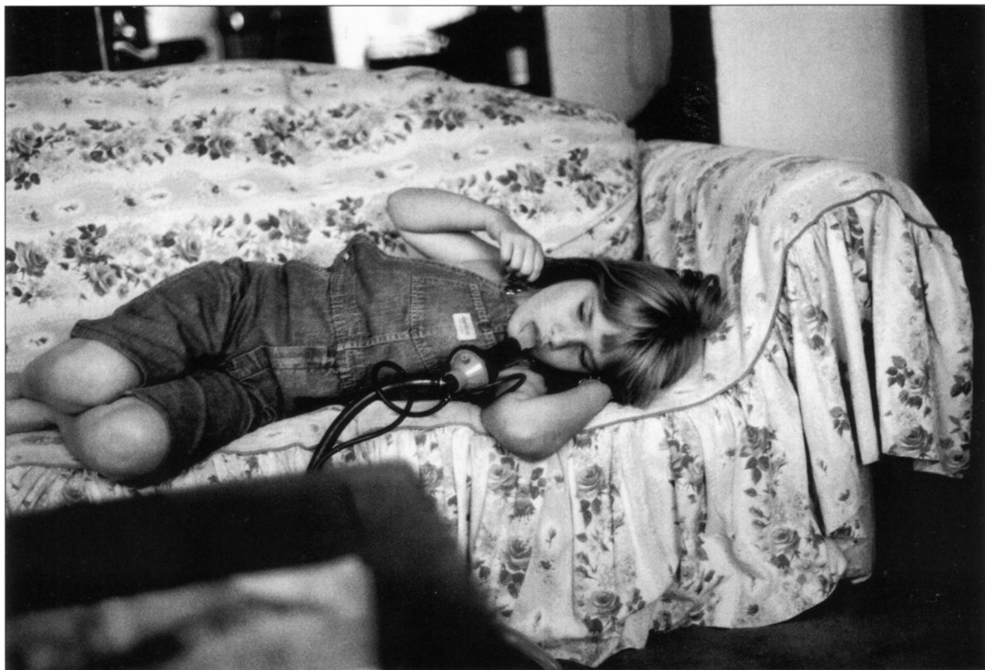
Prix spécial Héloïse BLIER

Une sélection des meilleurs envois sera exposée du 16 avril au 16 mai 1997 à la galerie Autres Regards, 21 rue Simart- 75018 Paris.