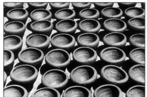
10 - Amir Nour Eddine (le Caire)